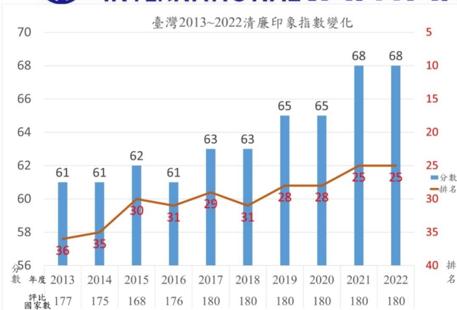
臺灣2013~2022清廉印象指數變化

The perceived levels of public sector corruption in 180 countries/territories around the world.